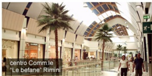
centro Comm.le "Le befane" Rimini